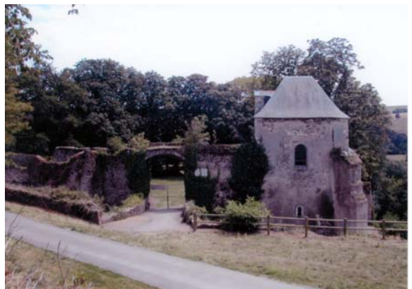
La "maison" de Joachim Du Bellay

Cette exploitation diversifiée du lieu est évidemment facilitée par le fait que, durant cinq jours, les élèves ne le quittent qu'une seule fois, pour visiter le musée Du Bellay dans le village de Liré tout proche (cf. fiche B1).