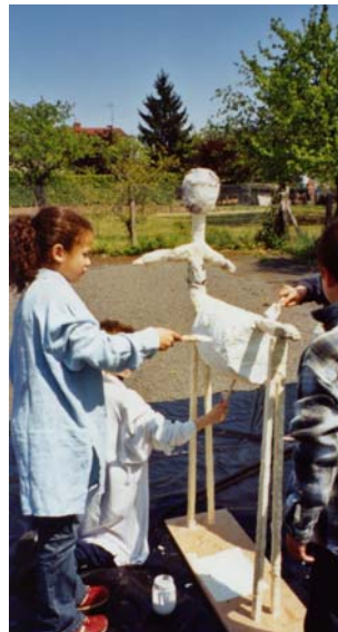
La fabrication d'un centaure