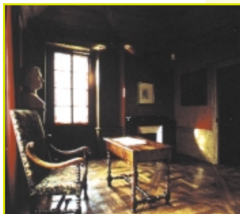
Le cabinet de travail d'Honoré de Balzac Maison de Balzac, Paris