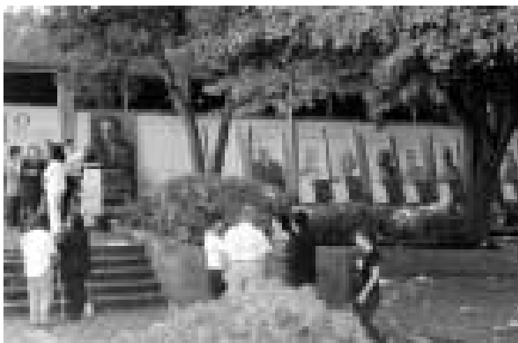
Entrée des participants dans la salle de réunion attenante à la Maison-Musée Abel Salazar à Matosinhos, Portugal.