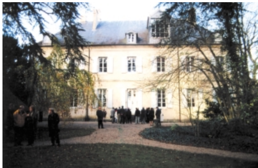
Le Domaine de Nohant, maison de George Sand

De nombreux élèves d'écoles, collèges et lycées de l'académie d'Orléans-Tours, riche en lieux sandiens, ont fêté, cette année, la femme singulière qui a marqué son temps, et sa région berrichonne.