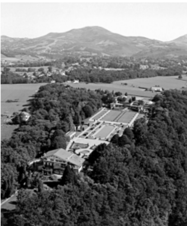
Vue aérienne du domaine

En 1906, les travaux terminés, la famille Rostand s'installe à Arnaga. Le jardin à la française étend ses broderies de buis et ses bassins géométriques devant la façade orientale. Le côté ouest, qui domine une boucle de la Nive, se prête aux rêveries romantiques : c'est le jardin à l'anglaise.