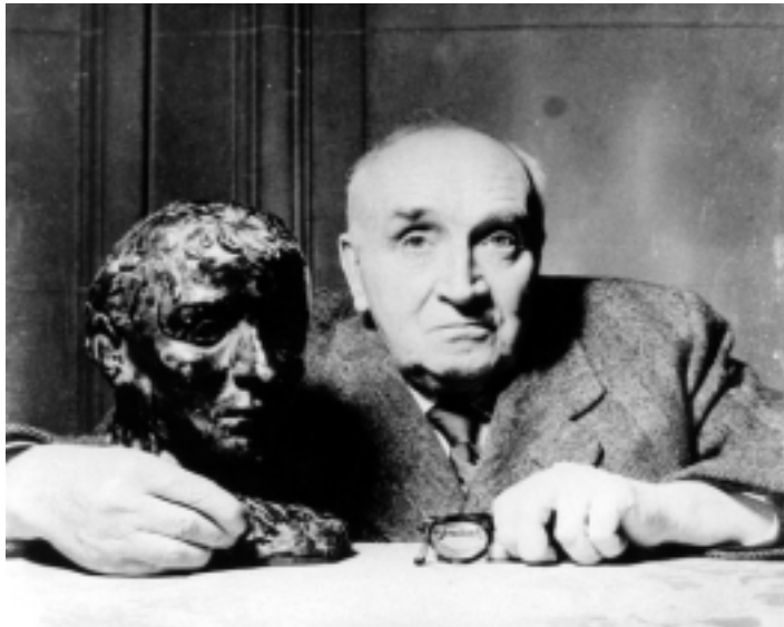
Paul Claudel entourant le buste de Camille par Rodin.

(Villeneuve-sur-Fère, 1868 – Paris, 1955).