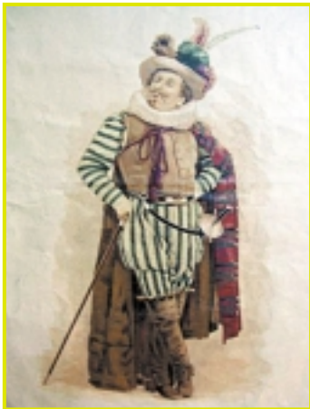
Coquelin en Cyrano. Aquarelle de M.A. Damourette d'après la photographie de P. Boyer publiée dans « L'illustré » n°8 du 20/02/1898.