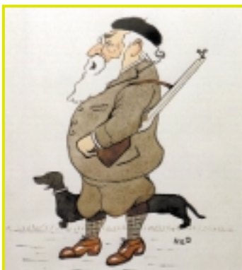
Caricature de Francis Jammes et son chien Rustic par HED.