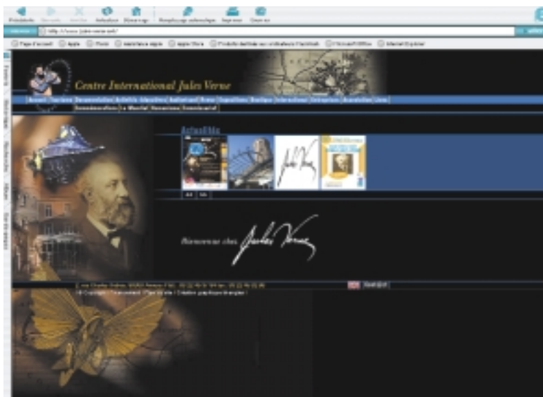
La page d'accueil du nouveau site www.jules-verne.net

En 2005, la Maison de Jules Verne commémore le centenaire de la disparition de l'écrivain amiénois. Le Centre International Jules Verne multiplie donc les initiatives :