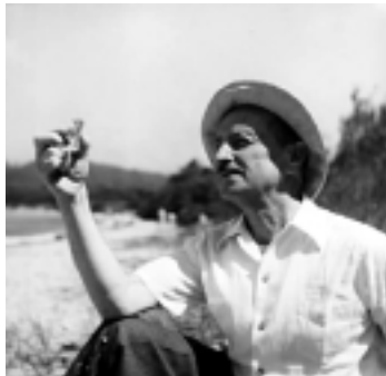
Saint-John Perse en Provence