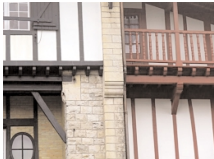
La nouvelle décoration extérieure : le rouge basque