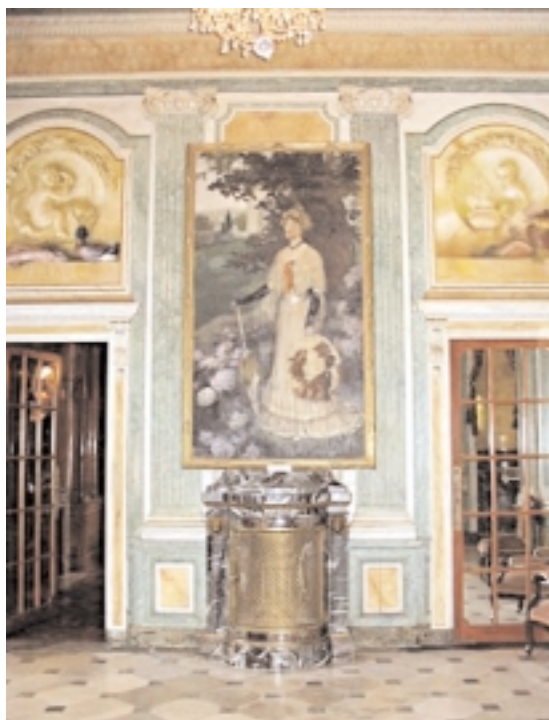
La salle à manger

Le programme prévoyant la remise en état et le ravalement des façades devait reprendre la couleur existante, c'est-à-dire, un vert sombre très répandu dans la région. Or nous venions de retrouver dans les archives du musée un autochrome représentant la maison photographiée du côté sud, dont la hauteur de la végétation permettait d'estimer la date entre 1910 et 1914. La plaque de verre laisse voir en positif une couleur uniforme des boiseries, colombages et pergolas : la maison, dans son état premier, était rouge. Nous avons ainsi une première confirmation du témoignage écrit de Paul Faure. C'est l'arrivée inopinée à Arnaga d'archives données par la