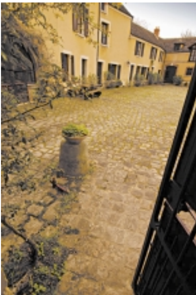
La cour pavée – crédit photo : Jean-François Lange

enseignants pour mieux répondre à leurs attentes et à leurs besoins. En 2007, les étudiants d'une école parisienne d'arts graphiques exposeront à la Maison leurs affiches et travaux accomplis à partir du poème d'Aragon « l'Affiche rouge » (centenaire de Missak Manouchian).