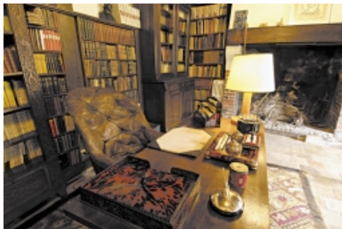
Le bureau d'Aragon

l'envie, d'alimenter un désir de découverte : « Si, si, la littérature, la poésie, c'est pour vous, ça s'adresse à vous, ne passez pas à côté ! » Nous disons beaucoup d'extraits de texte des deux écrivains pendant la visite de leur maison, nous avons parsemé le parc de leurs textes, des vers (les plus connus) flottent au fil des eaux qui traversent la propriété. Ce n'est pas seulement une maison d'homme célèbre, c'est une « maison d'écrivain », et un écrivain c'est d'abord des textes, un style... Rien ne nous rend plus heureux que la remarque souvent faite en fin de visite : « Écoutez, en arrivant ici je ne savais même pas qui étaient Aragon et Elsa Triolet, vous m'avez donné envie de les découvrir ! ». Souvent l'achat d'un livre est la preuve de cette petite flamme fragile allumée !