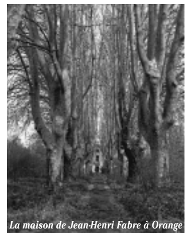
La maison de Jean-Henri Fabre à Orange