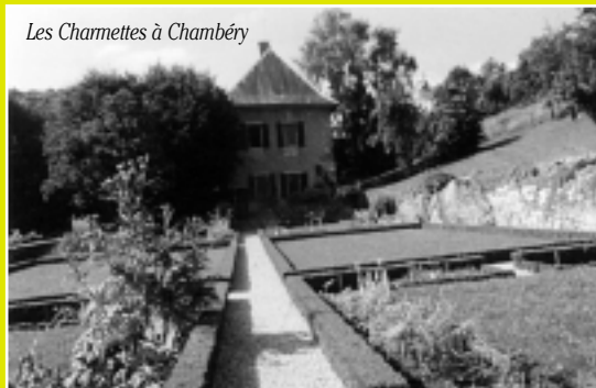
Les Charmettes à Chambéry