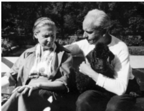
Elsa Triolet et Aragon