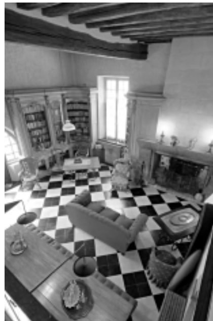
Le grand-salon