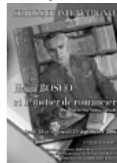
Affiche du colloque

Relieur d'art internationalement reconnu, c'est à Aix que travaille Renaud Vernier depuis plus de vingt ans. Un collectionneur privé a exceptionnellement présenté, du 1 er au 30 septembre 2006, une collection unique de ces reliures à la Fondation Saint-John Perse. Le vernissage a eu lieu le samedi 2 septembre, en même temps que pour l'exposition Une passion en lumières : le marquis de Méjanes et ses livres , présentée par la Bibliothèque Méjanes à la Galerie Zola. Ces manifestations se sont déroulées dans le cadre du 27 e colloque de l'Association internationale de biblio-