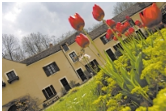
Le moulin de Villeneuve

Maison Elsa Triolet-Aragon Moulin de Villeneuve 78730 Saint-Arnoult-en-Yvelines Site Internet : http://www.maison-triolet-aragon.com Courriel : triolet-aragon@wanadoo.fr Tél. : 01 30 41 20 15 - Fax : 01 30 41 43 92