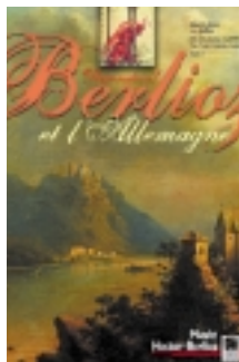
Affiche de l'exposition.

Courriel : moniot.rene@wanadoo.fr Tél : 02 51 98 55 04