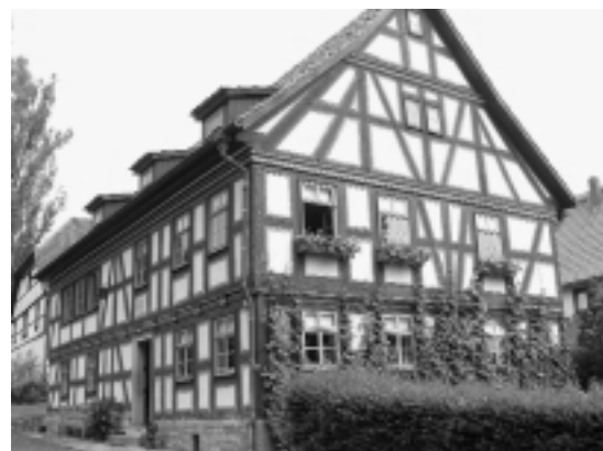
Maison de Schiller à Bauerbach

Notons que les liens et la coopération avec l'Université sont multiples et concrets, dans la mise en place des conseils scientifiques, l'accueil des