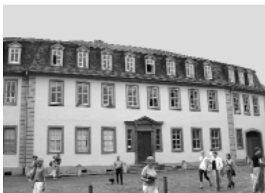
Maison de Goethe à Weimar

Association Camille & Paul Claudel en Tardenois - 4 route de Rugny - 02130 Arcy-Sainte-Restitue Site Internet : http://www.litterature-lieux.com/association-camillepaulclaudel Courriel : association-cpc@wanadoo.fr Tél./Fax : 03 23 55 23 77