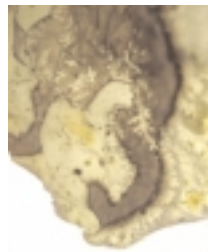
Sentinelle de l'immobile - détail

Exposition du 2 septembre au 26 novembre - du mardi au dimanche de 14 h à 18 h. Inviter Solirenne au Cayla n'est pas un geste anodin. Il est le résultat d'une rencontre entre deux formes d'expression, de deux femmes qui ne se ressemblent pas. Le projet plastique a pris forme peu à peu au cours de promenades, dans des carnets de lecture où les phrases de Solirenne sont venues en écho heurter les mots d'Eugénie de Guérin (1805-1848). Les installations que