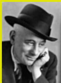
Max Jacob, portrait aux bagues © Musée des Beaux-Arts d'Orléans.

Inauguré le 5 mars 2006 - jour du 62 e anniversaire de la mort du poète - ce site permet de s'initier à la vie et à l'œuvre de Max Jacob. Conçu dans un souci de sobriété documentaire, il relate également la vie de l'association des Amis de Max Jacob, créée en 1949, et recense l'intégralité des parutions sur le poète (livres, films, émissions radio-