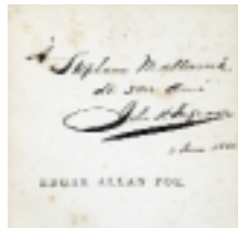
Envoi manuscrit de John Ingram à Mallarmé sur son ouvrage Edgar Poe, His Life, Letters and Opinions , 1880.

Cassatt et fut l'ami intime du peintre Whistler. Mais Anglais, Américains et même Australiens ne sont pas en reste : leurs traductions et leurs études de l'œuvre du poète ont permis sa diffusion dans tout le monde anglophone.