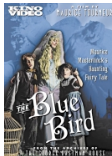
Maurice Tourneur, The Blue Bird , édité en DVD par Kino

A mi-chemin de l'entretien et de l'évocation, on citera la collection produite par l'ORTF Lire c'est vivre (13 numéros) ou, plus récente, celle des Hommes-livres de Jérôme Prieur (15 numéros de 1988 à 1999), où figurent des films d'une qualité exceptionnelle, consacrés à Edouard Glissant, Philippe Jaccotet, Louis-René Desforêts... Moins connues mais fort intéressantes sont les séries consacrées aux écrivains contemporains : Histoires d'écrivains (13 titres : Lydie Salvayre, Emmanuelle Bernheim, Pierre Michon, Sylvie Germain...), A mi-mots (5 titres : Antonio Lobo Antunes, Pascal Quignard, Erri De Luca...). La série L'Atelier d'écriture , produite par Avidia et le Centre Georges Pompidou