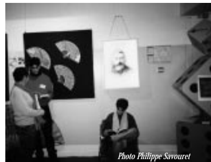
L'expérience du Collège de Sens autour de Stéphane Mallarmé, éventails et borne interactive