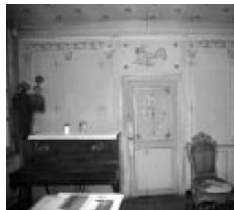
Chambre des Abeilles

Dans un premier temps ce relevé constitue une représentation exacte de la maison à un moment donné, une sorte de mémoire historique qui servira d'outil de référence pour toutes les interventions