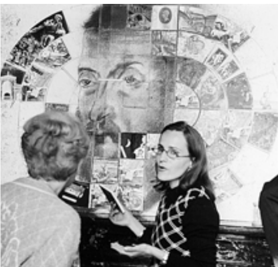
Présentation du jeu de l'oie à Liré - Photo : J.-F. Goussard