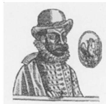
Auger Gaillard, poète du XVI e siècle

En partenariat avec les archives départementales, la médiathèque d'Albi, la bibliothèque de Castres, cette exposition dans la maison de Maurice et Eugénie de Guérin, organisée par la Conservation départementale, dresse un panorama de l'histoire de la poésie dans le département du Tarn sur plusieurs siècles. Elle en présente les figures principales dans des panneaux didactiques qui circuleront ensuite dans les bibliothèques et les écoles. Une série de documents originaux seront proposés au public, grâce au concours de plusieurs organismes prêteurs.