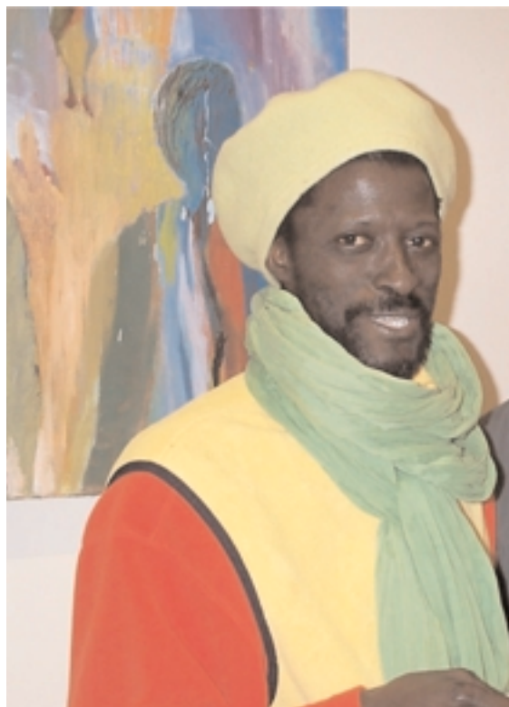
Babacar Keemtaanne : artiste sénégalais parle de la langue française et de la culture de son pays