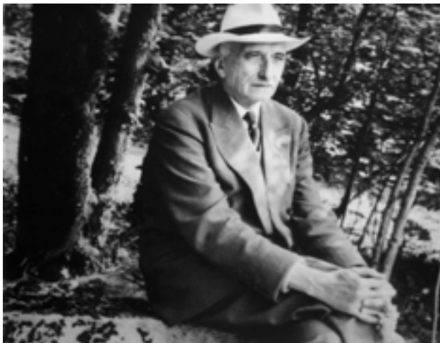
François Mauriac sur la terrasse