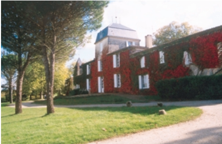
La façade nord de Malagar en automne

Le voyageur qui, venant de l'un des quatre coins du monde, découvre Malagar, ne peut manquer d'être saisi par la beauté exceptionnelle du site. Le "château" de Malagar, posé comme par enchantement sur la douce colline qui domine la vallée de la Garonne, entourée d'un parc au charme indéfinissable, borné au Sud par sa fameuse terrasse, si merveilleusement célébrée par François Mauriac et son fils Claude, est un lieu inspiré où souffle l'esprit, où la nature et l'homme se conjuguent dans la plus noble des harmonies. Le calme, la sérénité liés à tous les souvenirs qu'évoque ce lieu magique donnent aux visiteurs des moments d'éternité.