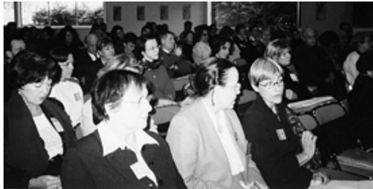
L'assistance - Photo : V. Espin

C'est un sujet bien intéressant, mais particulièrement difficile qu'ont abordé les 6 e Rencontres de Bourges, les 16 et 17 novembre 2001 : les lieux littéraires, espaces de création. Près de cent vingt personnes ont participé à ces deux journées au Palais des congrès.