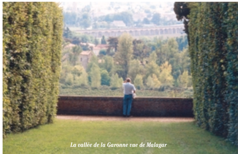
La vallée de la Garonne vue de Malagar

"Entrée officielle" des invités, le vestibule offre deux perspectives opposées mais complémentaires du paysage "malagarien". Grâce à deux portes-fenêtres en vis-à-vis, le visiteur pénètre au plus près de l'intimité de l'auteur du Nœud de