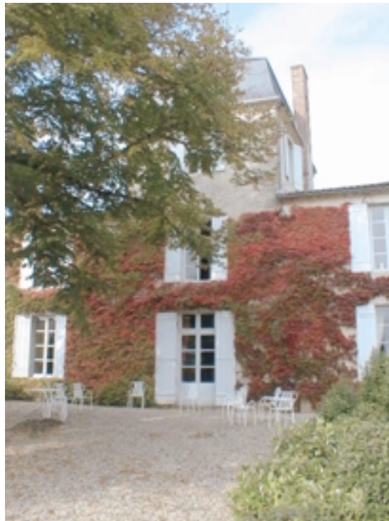
La façade en automne (cour intérieure)

Dans ce salon, " lieu excitant pour mon travail, véritable forcerie à l'usage du romancier où les livres mûrissent en trois semaines, où, bousculé par mon démon, j'écris si vite que je ne puis même plus me relire si je néglige de dicter le soir même mon travail de l'après-midi ", des portraits