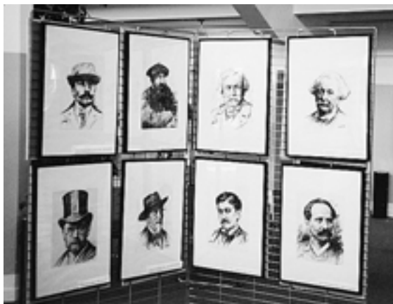
Portraits d'écrivains par Fang