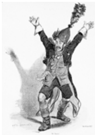
Chicard - lithographie coloriée de Gavarni - Maison de Balzac