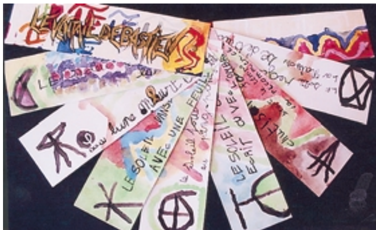
Eventail réalisé en classe après la lecture d'haïku extraits de Cent phrases pour eventails de Paul Claudel

En 2000, le Conseil général de l'Aisne a racheté le presbytère de Villeneuve-sur-Fère, maison natale de Paul Claudel pour le faire restaurer et l'ouvrir au public. Dans l'état actuel des choses, le plus intéressant à découvrir, et tout à fait accessible, c'est le territoire de Villeneuve (le village et la Hottée du Diable) que Camille et Paul Claudel exploiraient lorsqu'ils étaient enfants. Il est à la source de leur inspiration et de leur création, (une grande partie de l'œuvre théâtrale de Paul Claudel a le Tardenois pour décor). L'association Camille et Paul Claudel en Tardenois, créée en 1998, a pour objet la mise en valeur du presbytère et du territoire de Villeneuve ainsi que toutes les manifestations artistiques ou culturelles liées à ces lieux. Après