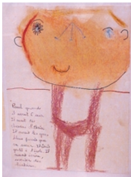
Paul Claudel à 6 ans - Dessin d'élève