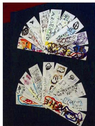
Deux éventails réalisés par les élèves

Alternance de travail avec la classe entière (découverte de l'œuvre et des contraintes du haï ku) et en ateliers (écriture et travail sur support éventail). L'activité est à réaliser pendant le temps scolaire, avec l'enseignant et un intervenant extérieur.