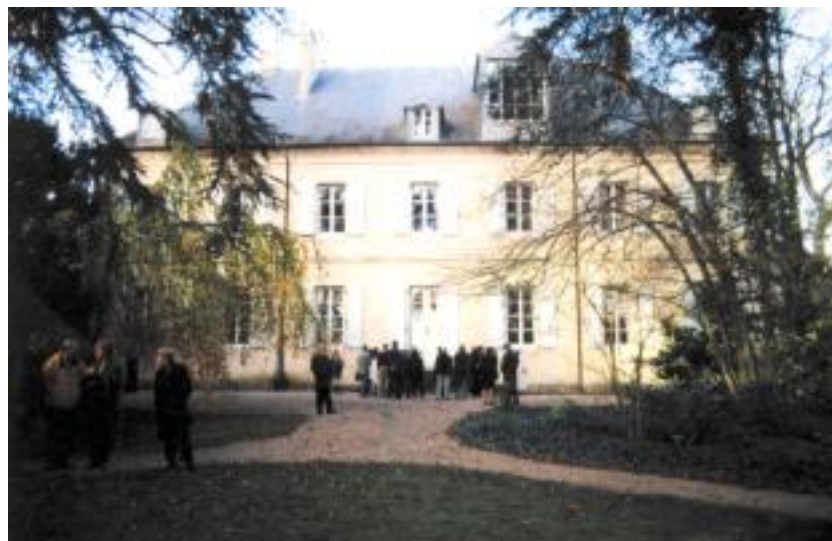
Le Domaine de Nohant, maison de George Sand

De nombreux élèves d'écoles, collèges et lycées de l'académie d'Orléans-Tours, riche en lieux sandiens, ont fêté, cette année, la femme singulière qui a marqué son temps, et sa région berrichonne.