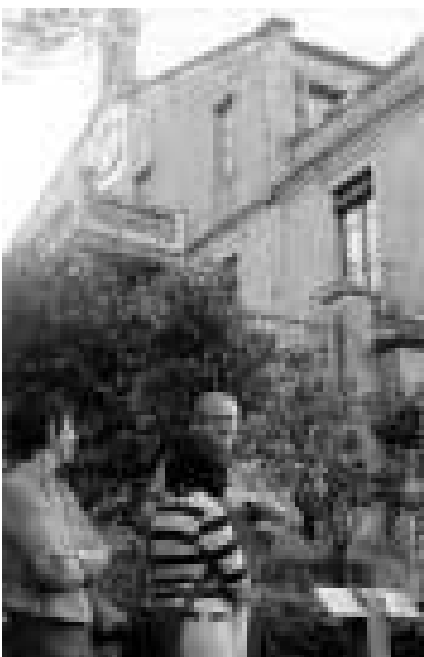
Itinéraire poétique devant la maison-musée Verdaguier à Vallvidrera, près de Barcelone.