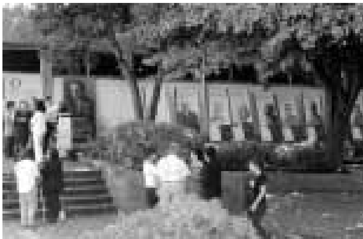
Entrée des participants dans la salle de réunion attenante à la Maison-Musée Abel Salazar à Matosinhos, Portugal.