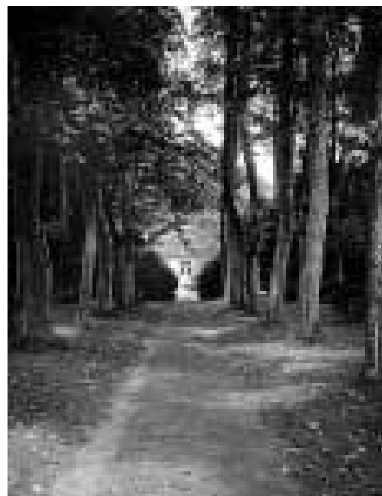
La Maison de Pierre Benoit

La Pelouse Maison de Pierre Benoit. 650 avenue Pierre Benoit 40990 Saint-Paul-Hès-Dax Tél. : 05 58 91 29 16