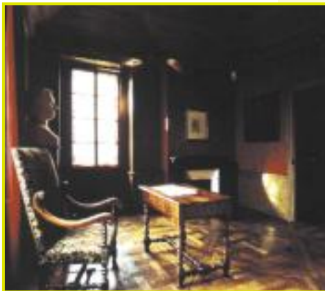
Le cabinet de travail d'Honoré de Balzac Maison de Balzac, Paris