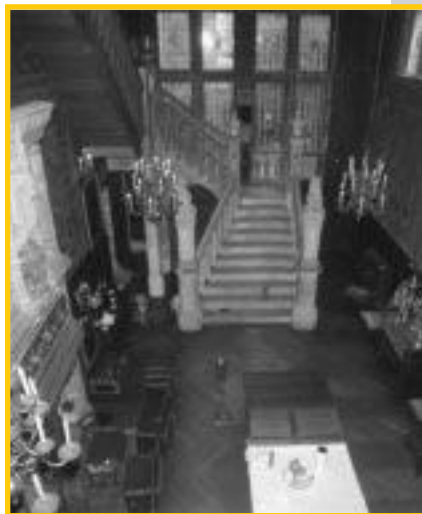
Maison de Pierre Loti, Salle Renaissance, Rochefort-sur-mer