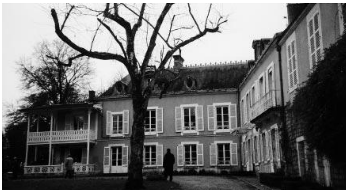
Château de Frapesle, près d'Issoudun