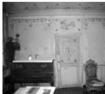
Chambre des Abeilles

Dans un premier temps ce relevé constitue une représentation exacte de la maison à un moment donné, une sorte de mémoire historique qui servira d'outil de référence pour toutes les interventions