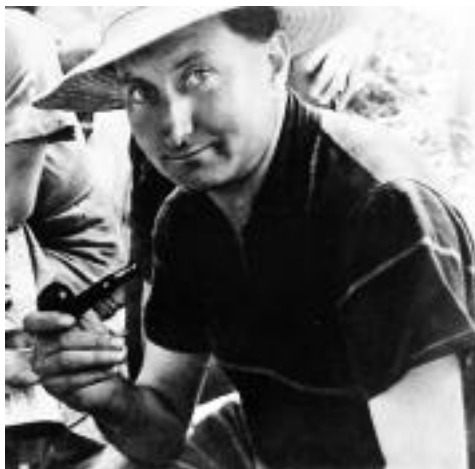
Giono au Contadour

Né à Manosque en 1895, Giono n'a jamais quitté sa ville natale. En 1930, après le succès fulgurant de son roman Colline , il décidait d'abandonner son travail à la banque et de consacrer sa vie à l'écriture, en même temps qu'il acquérait une petite maison, " le Paraïs ", sur les pentes de la colline du Mont d'Or . Il y restera jusqu'à sa mort, en 1970. L'Association des Amis de Jean Giono, installée dans l'une des pièces de cette maison, depuis 1984, la fait visiter gratuitement, sur rendez-vous, aux amateurs de l'œuvre gionienne, un après-midi par semaine. Il manquait à Manosque, à côté de cet émouvant lieu de mémoire, un espace plus grand, destiné à faire connaître l'écrivain à un vaste public, à répondre aux demandes des chercheurs de plus en plus nombreux sur l'œuvre de Giono, et à inventer différentes animations autour de cette œuvre foisonnante.