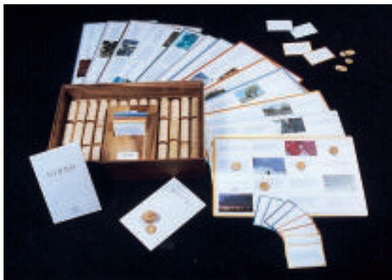
Le " loto-poésie "

Il s'agit d'un outil d'initiation aux textes de Jean Giono et de diffusion de son oeuvre. Il participe aussi, pour un public scolaire, à l'apprentissage de l'écoute, de la lecture, de la diction (chaque