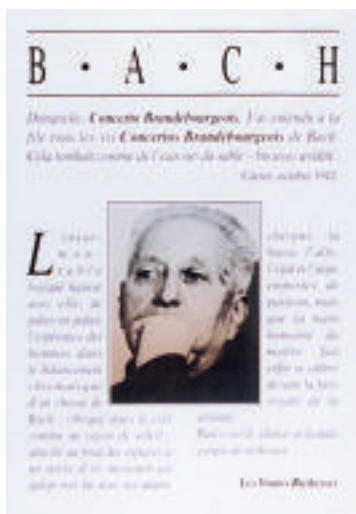
Exposition itinérante

Une expertise, faite en 1999 par M. Thierry Bodin, avait estimé la