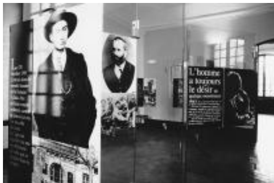
Salle d'exposition permanente

Le rez de chaussée propose une exposition permanente " Jean Giono ou le voyageur immobile ". Réalisée en coproduction avec l'Association " Confluences " de Montauban, cette exposition offre aux visiteurs une invitation au voyage dans l'œuvre d'un écrivain, apparemment sédentaire, mais qui poursuit, toute sa vie durant, un fabuleux périple intérieur dans l'imagination et l'écriture, " divertissement de roi ". Quarante-cinq panneaux-étapes avec, chacun, une citation de l'œuvre, une photo, quatre panneaux biographiques " classiques " seulement. L'objectif n'est pas d'amener le visiteur à une