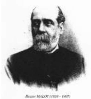
Hector MALOT (1830 - 1907)

Tél : 01 41 11 12 76. Fax : 01 47 33 83 68