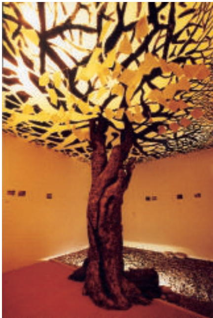
" L'arbre d'or " visuel de l'exposition " Que ma joie demeure "