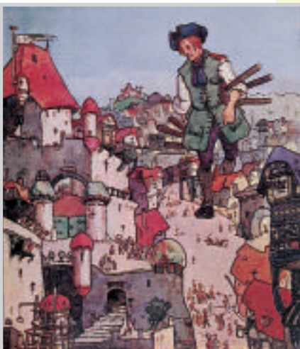
Gulliver à Mildendo (Stephen Baghot de la Bère)