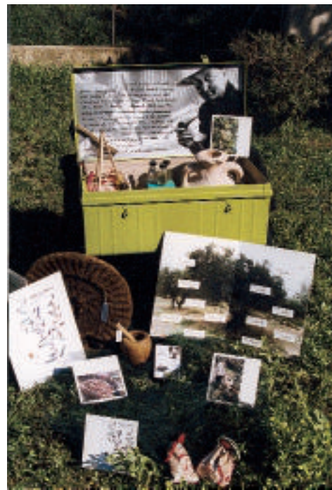
La malle de l'olivier

ment très profond d'appartenance à une civilisation méditerranéenne millénaire. Le but de cette malle est donc de permettre aux enfants d'aborder simultanément l'univers d'un des grands écrivains de ce siècle, et de façon ludique, d'élargir