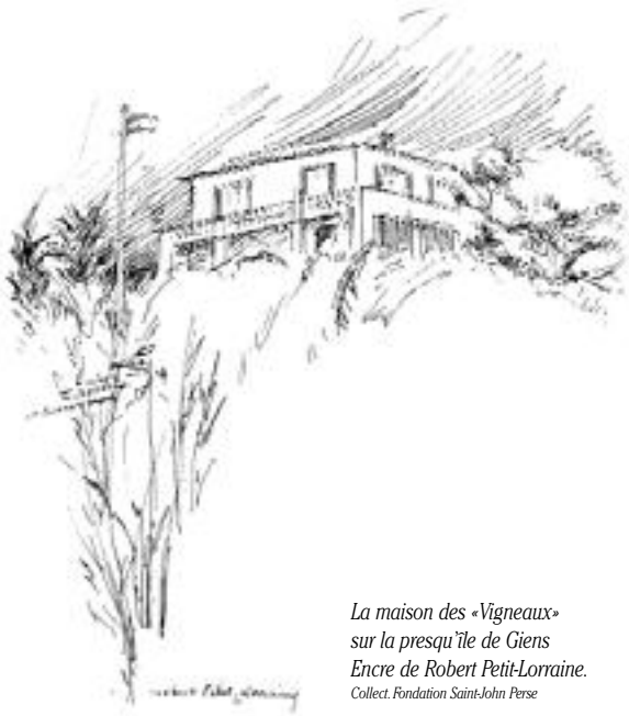
La maison des «Vigneaux» sur la presqu'île de Giens Encre de Robert Petit-Lorraine. Collect. Fondation Saint-John Perse