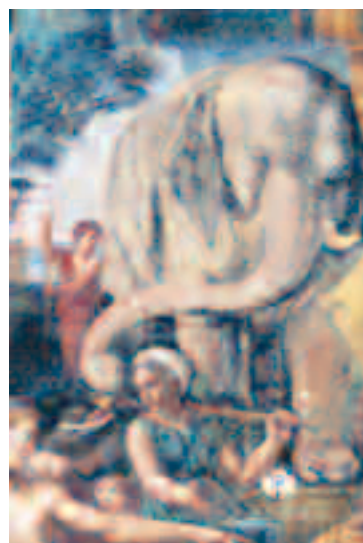
Détail d'une fresque de Giulio Romano au Palazzo Te à Mantoue

Du 5 au 9 septembre, s'est tenu à Mantoue, en Lombardie, le 5e Festival international de littérature