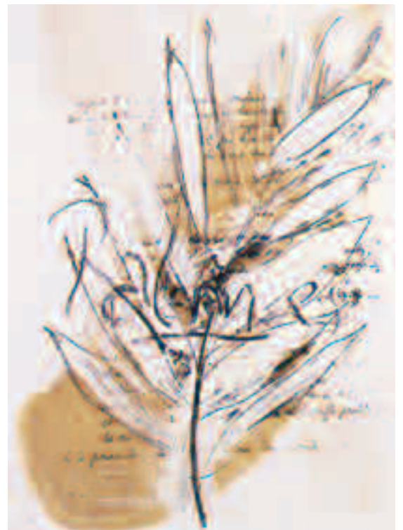
Palmes, peinture de Christian Perrais d'après Exil, 1997

De multiples dossiers complètent enfin la donation. N'oublions pas que le poète-diplomate fut un