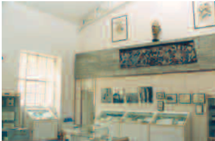
La salle d'exposition de la Fondation

siers permettent au visiteur de pénétrer l'univers culturel d'un grand poète français du XX e siècle. Ces collections se distinguent par leur caractère patrimonial (quatorze mille cent documents ont appartenu à Saint-John Perse) et leur diversité.