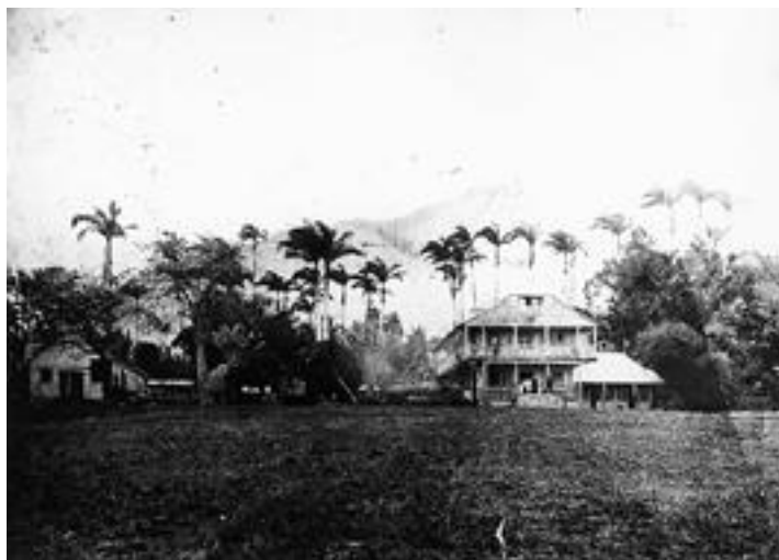
« Bois-Debout », plantation de la famille maternelle en Guadeloupe

Environ seize mille sept cent documents, manuscrits, correspondances, livres de la bibliothèque personnelle, éditions de l'œuvre, travaux critiques, photographies, œuvres d'art, objets, disques et dos-