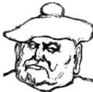
Pierre Mac-Orlan par Henri Landier Eau forte, 1959

Du 7 octobre 2001 au 10 mars 2002. Musée des Pays de Seine-et-Marne, 17 avenue de la Ferté-sous-Jouarre, 77750 Saint-Cyr-sur-Morin. Tél. : 01 60 24 46 00. Fax : 01 60 24 46 14. Mél : mpsm@wanadoo.fr