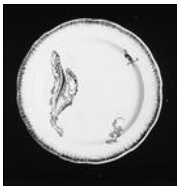
Assiette du service Rousseau, 1866, faïence fine (Musée départemental Stéphane Mallarmé)

Au travers d'environ 200 numéros - œuvres et documents- le musée départemental Stéphane Mallarmé présente une exposition temporaire sur le service Rousseau, un service en faïence fine de forme Louis XV orné de motifs du peintre et graveur Félix Bracquemond et fabriqué par la Manufacture de Creil et Montereau à partir de 1866, à la demande du marchand-éditeur Eugène Rousseau. Le visiteur découvre également l'intérêt que manifesta Mallarmé pour le service Rousseau, à travers les pièces qu'il posséda, aussi bien que la critique positive qu'il en fit.