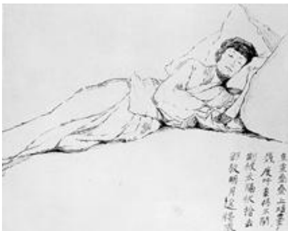
La jeune Xi – Dessin de Saint-John Perse – Collect. Fondation Saint-John Perse

Cité du Livre – 8/10 Rue des Allumettes 13098 Aix-en-Provence Cedex 2 Tél. : 04 42 25 98 85 – Fax : 04 42 27 11 86 Mél : fondation.saint.john.perse@wanadoo.fr http://www.up.univ-mrs.fr/~wperse/