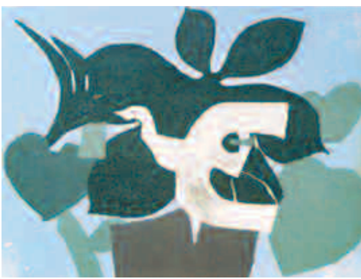
L'oiseau dans la paulownia - Eau-forte de Georges Braque, 1962 - Collect. Fondation Saint-John Perse

Créé récemment, un fonds annexe propose des ouvrages utiles au chercheur perse (usuels, œuvres d'auteurs amis, ouvrages sur la poétique ou autour des grands thèmes de l'œuvre). Parmi les neuf cents titres, on trouve quelques livres ayant appartenu à l'épouse de l'écrivain.