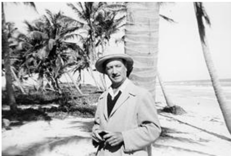
Saint-John Perse à l'île Nevis, aux Antilles anglaises, en 1946