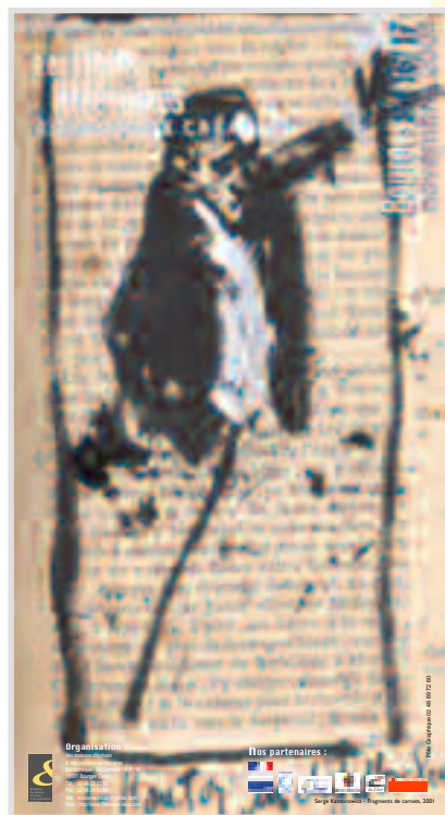
Affiche-programme des 6 e Rencontres des maisons d'écrivain et des patrimoines littéraires « Les lieux littéraires, espaces de création » Voir programme en p. 2