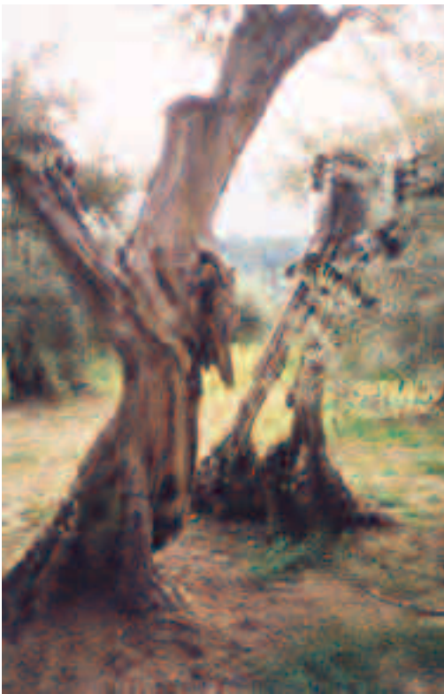
Les oliviers de Lurs