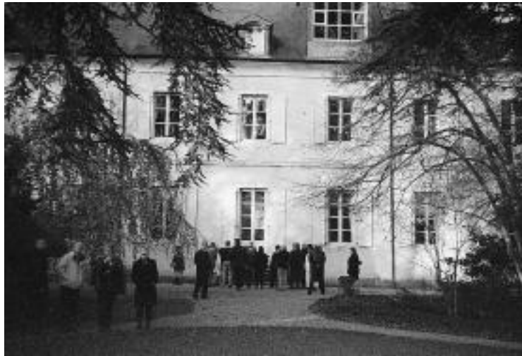
Devant la maison de George Sand à Nohant

nous saisit devant le caractère unique d'une œuvre contenant le geste du créateur, portant la trace et la marque de son action. Reproduire, c'est perdre le bénéfice de cette rencontre de l'œuvre, au lieu unique où elle se trouve.