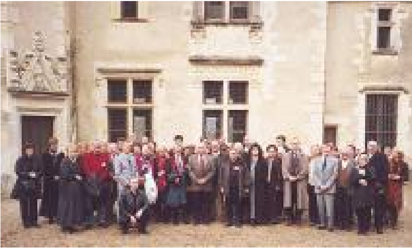
Les participants aux Rencontres devant le manoir de la Possonnaïère

Elle renoue avec un défi intéressant – que l'on voit émerger dans la première moitié du XVII e siècle – qui vise à transformer le corps de l'écrivain en support de dévotion, quasiment en relique, en le divisant, le dépeçant, le partageant, le distribuant. Aragon et Elsa, quant à eux, sont entiers, je vous rassure. Le rôle de l'écrivain lui-même comme acteur n'a pas cessé. De plus en plus sans doute, les écrivains seront amenés à collaborer à cette territorialisation de la littérature : il s'agit d'une sorte de retour qui tient compte des conditions contemporaines de la transmission littéraire.