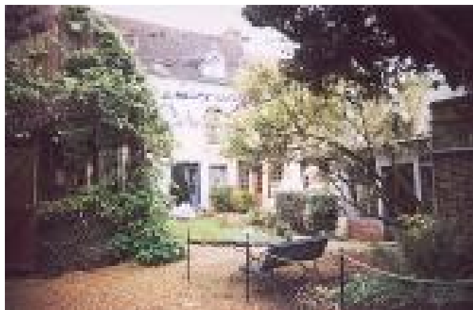
La maison de Tante Léonie à Illiers-Combray

que cette possibilité de reproduction et ces nouveaux moyens de diffusion démocratisent l'accès à l'œuvre, qu'elle soit plastique ou musicale. Mais en même temps, Benjamin introduit une réflexion nouvelle qui va nous être très précieuse. Dans la multiplication, on perd quelque chose, il y a la perte de ce qu'il propose d'appeler « l'aura », reprenant ce terme latin que vous retrouvez à la racine du terme « auréole ». L'aura est ce qui émane d'un être et d'une chose exceptionnels et qui englobe le spectateur ou l'auditeur, celui qui est mis en présence. L'aura est l'émotion particulière qui nous saisit dans la mise en présence de l'œuvre, liée à son caractère unique. La reproduction entraîne nécessairement une déperdition de l'aura, un effacement de ce frisson qui