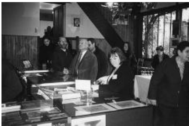
La librairie à Illiers-Combray

en même temps dans un moment de rupture critique de la transmission de la littérature, en particulier, comme religion nationale. D'où la crise que vivent les enseignants aujourd'hui. La difficulté qu'ils ont à transmettre la littérature dans leurs classes renvoie à une crise du canon littéraire. J'ai commencé ma carrière en enseignant la littérature dans un lycée, à une époque où l'on étudiait en classe de Première Andromaque , Don Juan et tous les classiques du XVIII e siècle. Cela a évidemment bien changé.