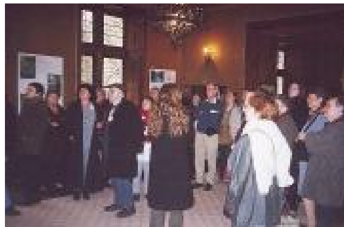
La salle des gardes au manoir de la Possonnière

Le dimanche matin, les participants se retrouvaient à Illiers-Combray, dans la « maison de Tante Léonie », dont le souvenir fut longuement célébré par Proust. Accueillis par Mireille Naturel et ses collaborateurs, ils purent ressentir le charme de la cuisine où officiait Françoise, assistée de « la Charité de Giotto », deviner les angoisses du