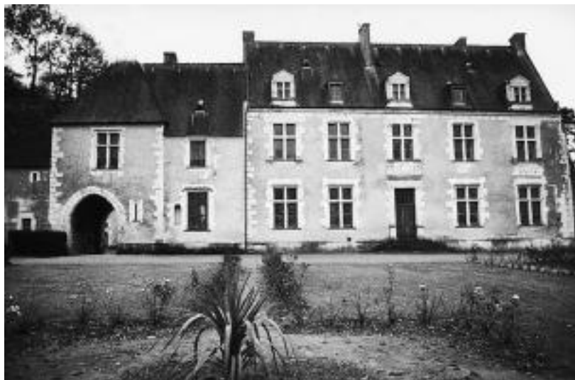
Le manoir de La Possonnière, maison natale de Ronsard

L'image. Un autre support important de la présence, assez peu utilisé en France, mais très cultivé en Allemagne ou en Italie, est le rassemblement en une