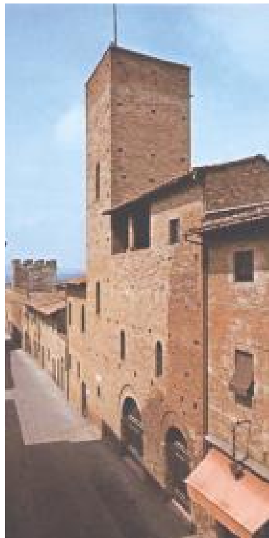
La maison de Boccaccio à Certaldo

Malagar : comment définir et créer une route européenne des maisons d'écrivain ? Pour elle, le tourisme littéraire reste trop confidentiel ; dans certains pays, comme la Finlande, la notion même de maison d'écrivain