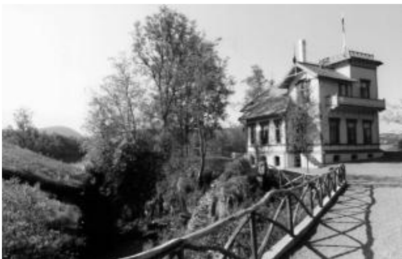
Le musée Edvard Grieg à Trolldhaugen (Norvège)