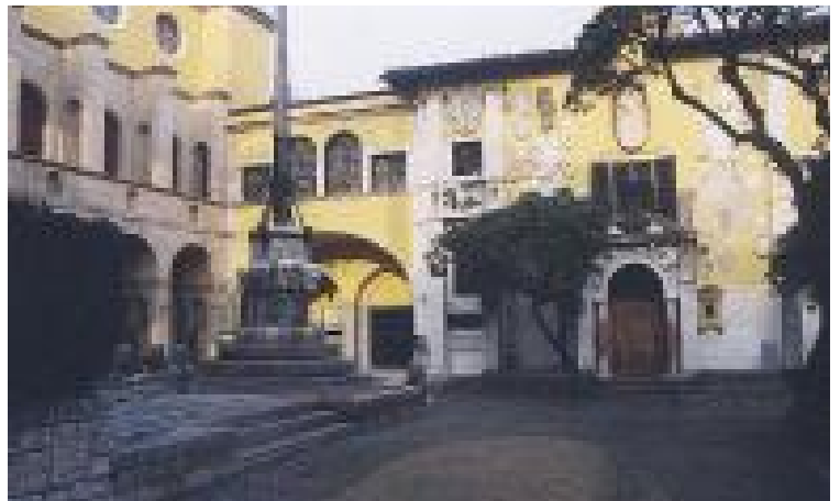
La maison de Gabriele d'Annunzio

Bien d'autres stratégies sont des paris sur l'immortalité, visant à perpétuer l'inscription terrestre de la littérature, non seulement dans les textes, mais précisément dans des lieux. Certaines autres tournent autour du corps de l'écrivain : je pense à Aragon et à cette double sépulture.