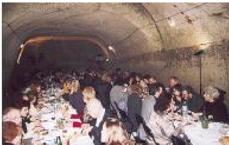
Déjeuner dans les caves troglodytes de la Possonnière