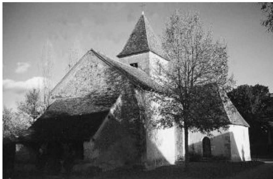
L'église de Nohant

érudits rouennais qui conservent dévotement une porte de la maison de Corneille, dont on ne sait pas très bien si c'est la vraie. La critique récente du XX e siècle l'a réaffirmé maintes fois avec force, relançant à propos de Mallarmé par exemple, la satire flaubertienne de toute forme de culte de la chose littéraire. Mais il ne suffit pas de constater cette contradiction, il faut la penser et la mettre en perspective de la manière suivante : plus la littérature réalise techniquement son être « ubiquiste », c'est-à-dire être de partout, plus l'aura qui naît du rapport singulier à l'objet, à la personne, à la situation unique, est ressentie comme une perte, et de ce fait, reconstituée par tous les moyens. Que nous soyons responsables d'un musée littéraire, d'une bibliothèque de manuscrits, d'une maison d'écrivain, animateur de fête littéraire ou de lecture publique, nous sommes des artisans de l'aura perdue, convaincus que le rayonnement de la littérature est aussi éprouvé dans une présence qui ne se substitue pas au texte, mais qui le souligne, le renvoie, l'entoure comme d'un halo, d'une auréole, d'une aura. Ce retour de l'aura est historiquement long et complexe, surtout pas homogène. Ses formes, ses cadres, ses styles dominants sont très divers : ces différences sont-elles