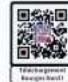
Histoire générale Bourges Nord I

Pour connaître l'histoire des quartiers Nord de Bourges, trois brochures éditées par la Ville d'art et d'histoire sont disponibles sur le site internet de la www.ville-bourges.fr