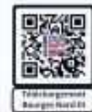
Histoire générale Bourges Nord III