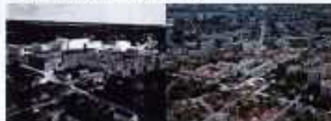
Cité-jardins fin des années 1908

Les débuts du XX e siècle voient se développer les premiers lotissements pavillonnaires de la fin des années 1900. A cette même époque se développe en France la construction de logements sociaux, dits Habitations à bon marché. Sous l'impulsion du maire Henri Lauthier, la cité-jardins sort de terre. Ce concept d'habitation devant réconcilier l'habitat en ville et en campagne a vu le jour en Angleterre à la fin du XIX e siècle