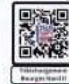
Histoire générale Bourges Nord II